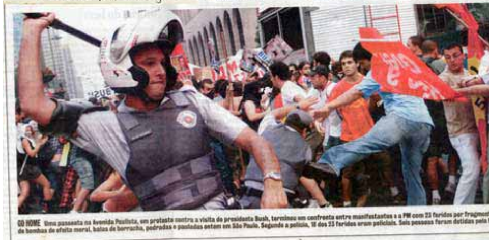
CO HOME Uma passeata na Avenida Paulista, em protesto contra a visita do presidente Bush, terminou em confronto entre manifestantes e a PM com 23 feridos por fragmentos de bombas de efeito moral, bolas de borracha, pedras e pauladas entre em São Paulo. Segundo a polícia, 11 dos 23 feridos eram policiais. Seis pessoas foram detidas pela PM