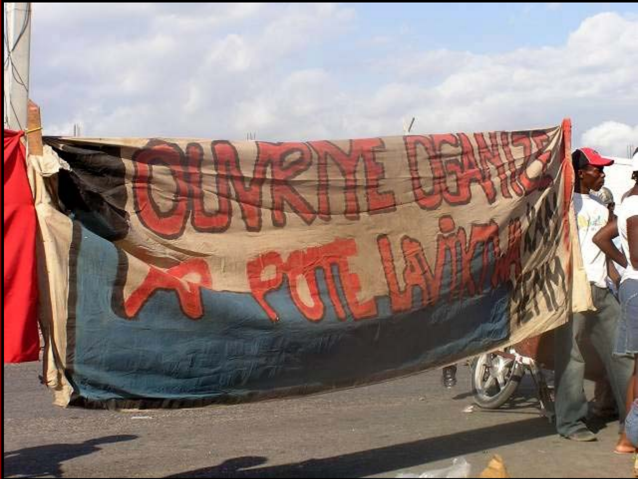
Batay Ouvriye Out 2009